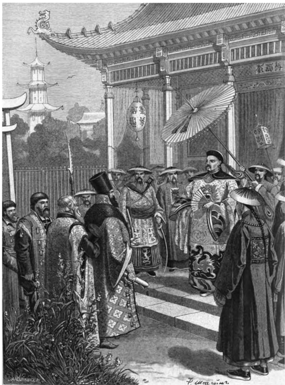
Р. Штейн. Русские послы XVII в. в Китае (Посольство Спафария) // Нива. 1886. № 42. С. 1048