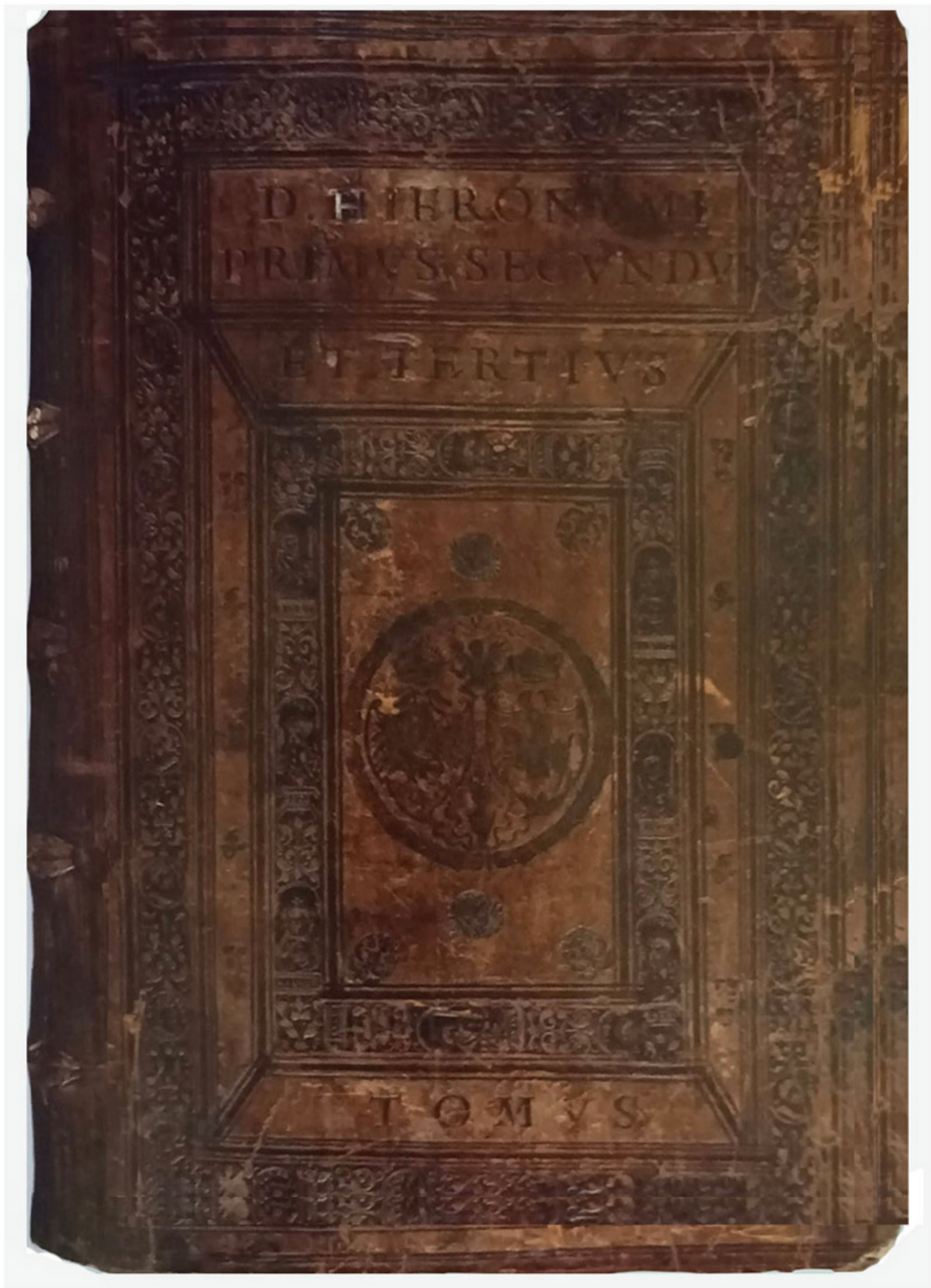
№ 21. Hieronimus. Opera omnia. Basel, 1573. Верхняя крышка переплета с гербовым суперэклибрисом библиотеки Сигизмунда II Августа