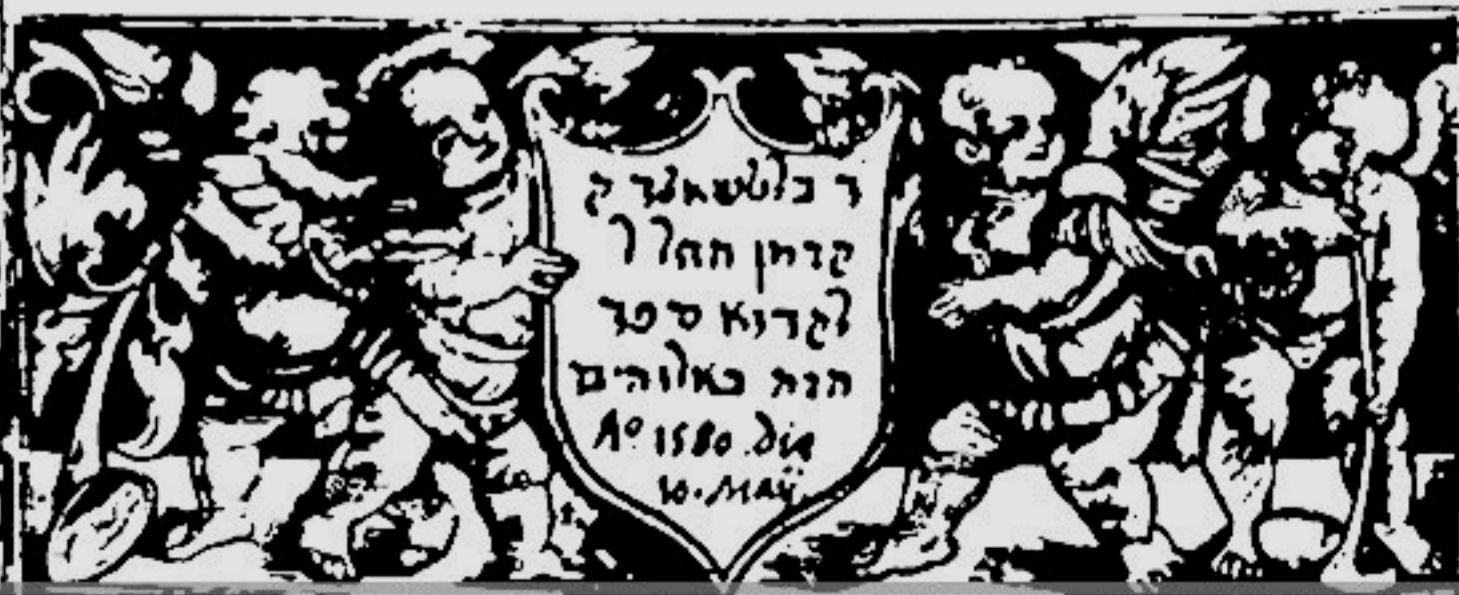
№ 10. Начало письма Эразма Роттердамского архиепископу Кентерберийскому Уильяму Уорхему в гравированной рамке