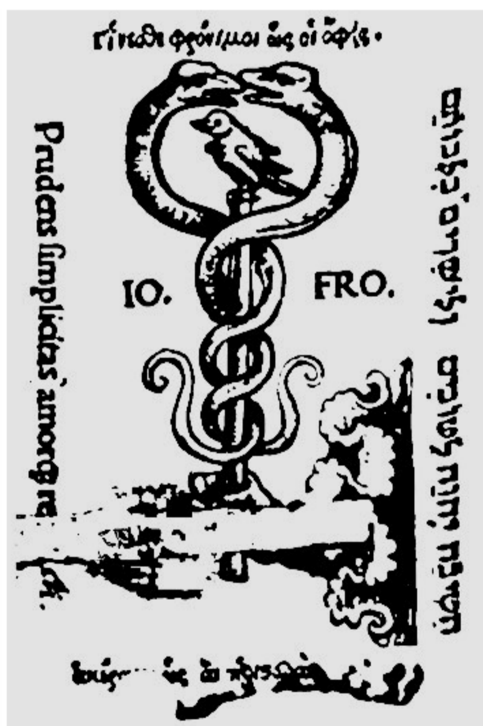
№ 10. Марка печатника

Библиография: Adams. I, P. 582, № 113; AT. T. 2. Ps. 1. P. 278; Panzer, T. 6. P. 196–198, № 160; Sebastiani, № 47. P. 221–236. РНБ: 15.33.2.7 (Т. 1–4); 17a.10.1.1 (Т. 1–3, 5–6). Шифр: 168.f.m/6742.