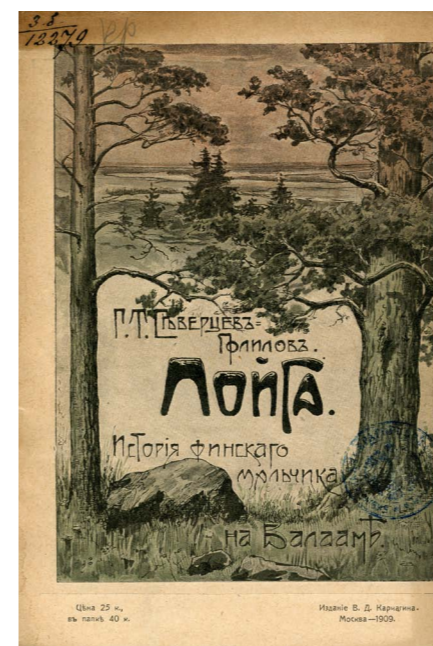
Москва, 1908 [1909]

Валаамская школа для мальчиков обучала преимущественно карел и финнов, была широко известна в Финляндии и существовала до переезда братии с острова вглубь страны зимою 1939 года. Из широко известных сегодня авторов, пожалуй, только Борис Зайцев потрудился как-то взглянуть летом 1935 года Валаамскую школу и тогда же рассказать о ней в парижском «Возрождении».