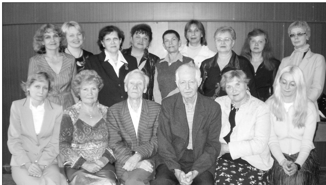
Кафедра библиотековедения и теории чтения, 2008