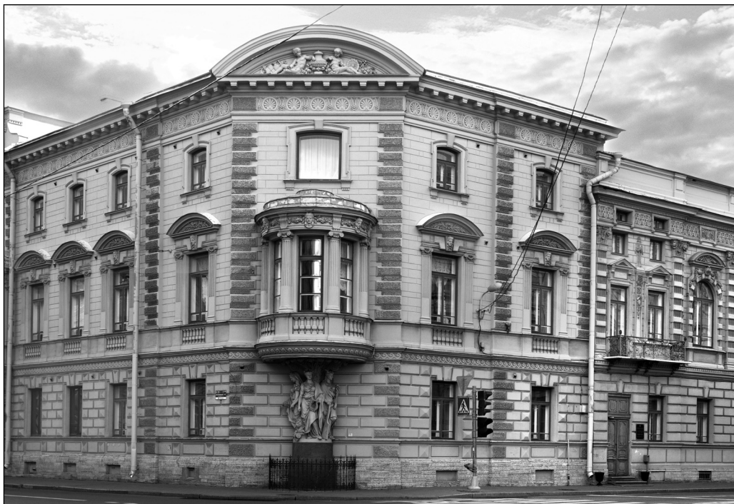
Учебный корпус СПбГИК (ул. Миллионная, д. 7)