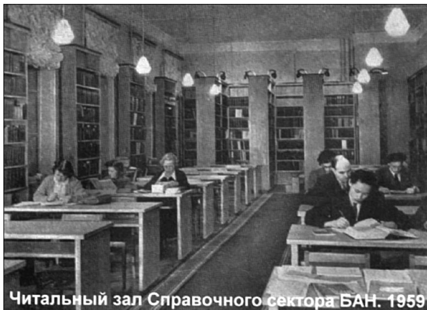
Рис. 4. Читальный зал Справочного подразделения Библиотеки в 1959 г.

С 1936 по 1956 гг. (см. Приложения 1.8-1.12) в инвентарные книги Справочно-библиографического отдела было занесено 19243 названий, из которых 978 периодических изданий. Периодика составляла в фонде