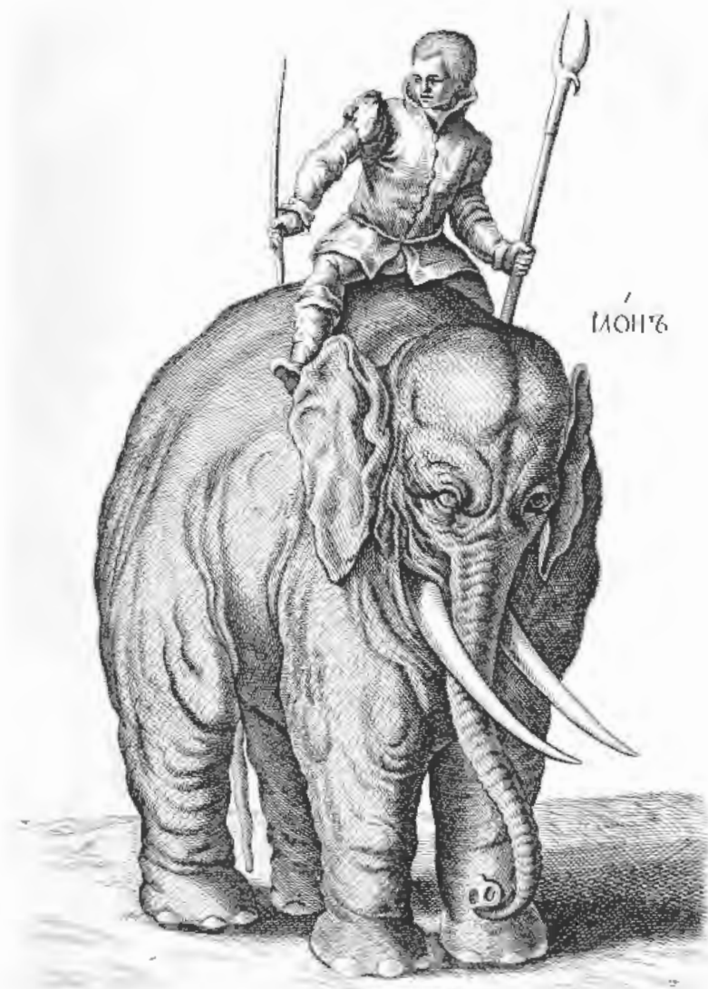
Рис. 9. Рукописное русское название животного на иллюстрации из книги: Historiaenatura lisequ adrupedi buslibri ... / Johannes Jonstonus, medicinae doctor, concinnavit. – Amstelodami [Amsterdam]: Apud Ioannem IacobiFil. Schipper, 1657