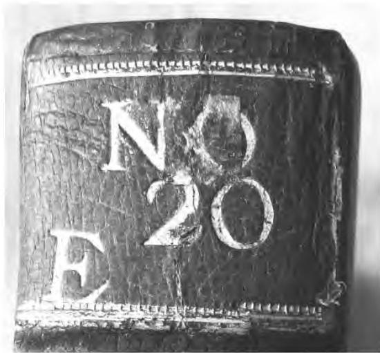
Рис. 6. Наклейка на корешке с систематическим шифром библиотеки Р. Арескина