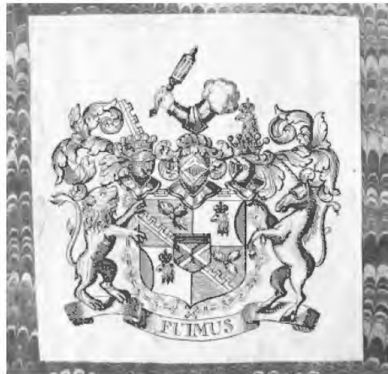
Рис. 7. Гравированный экслибрис Я. Брюса