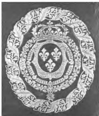
Рис. 10. Суперэклибрис французской Королевской типографии