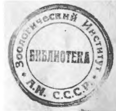
Рис. 18. Штамп «Зоологический институт А.Н. С.С.С.Р. Библиотека»