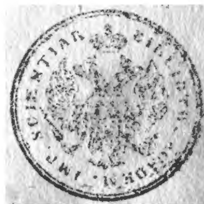
Рис. 4. Штамп «Biblioth. Academ Imp. Scientiar.»