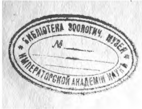
Рис. 17. Штамп «Библиотека Зоологич. музея Императорской академии наук»