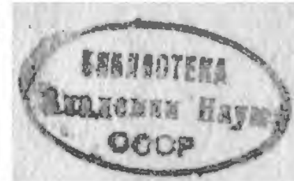
Рис. 16. Штамп «Библиотека Академии наук СССР»