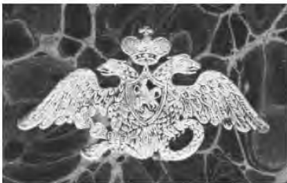
Рис. 15. Суперэклибрис в виде русского герба 1825 года