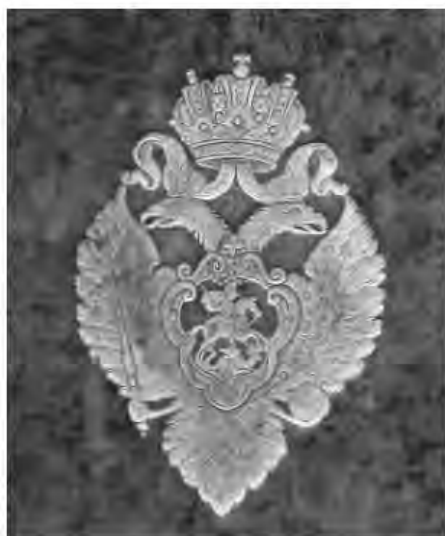
Рис. 12. Самый ранний суперэклибрис Академической библиотеки