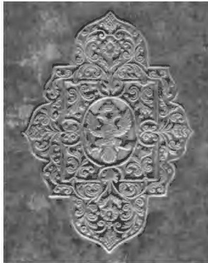
Рис. 14. Суперэклибрис елизаветинского времени