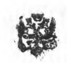
Рис. 1. Первоначальный штамп Академической библиотеки