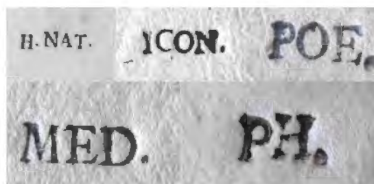
Рис. 2. Литерные знаки Камерного каталога