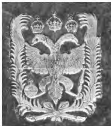
Рис. 11. Суперэклибрис, соответствующий зеркально отображенному российскому гербу 1667 года