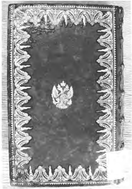
Рис. 13. Переплет 30-х гг. XVIII в. с гербовым суперэклибрисом