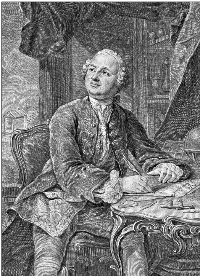
Портрет М. В. Ломоносова, исполненный Х. А. Вортманом, гравером Академии наук, около 1757 г.

РОССИЙСКАЯ АКАДЕМИЯ НАУК БИБЛИОТЕКА РОССИЙСКОЙ АКАДЕМИИ НАУК