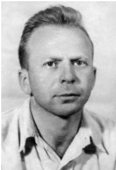
Из архива Библиотеки Ботанического института РАН