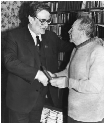
Д.В. Лебедев и министр экологии СССР Н.Н. Воронцов. Ленинград, 1990 г.

селекционеров и растениеводов, многие из которых отдали свою жизнь ради истины в науке 69 . В октябре 1990 г. за особый вклад в развитие генетики и селекции Д.В. Лебедев в составе группы ученых — борцов с лысенковщиной был награжден высшей государственной наградой — орденом Ленина 70 . По поручению правительства орден ему вручил единственный в истории СССР беспартийный министр Н.Н. Воронцов, который сам принадлежал уже к последующему поколению антилысенкоистов.